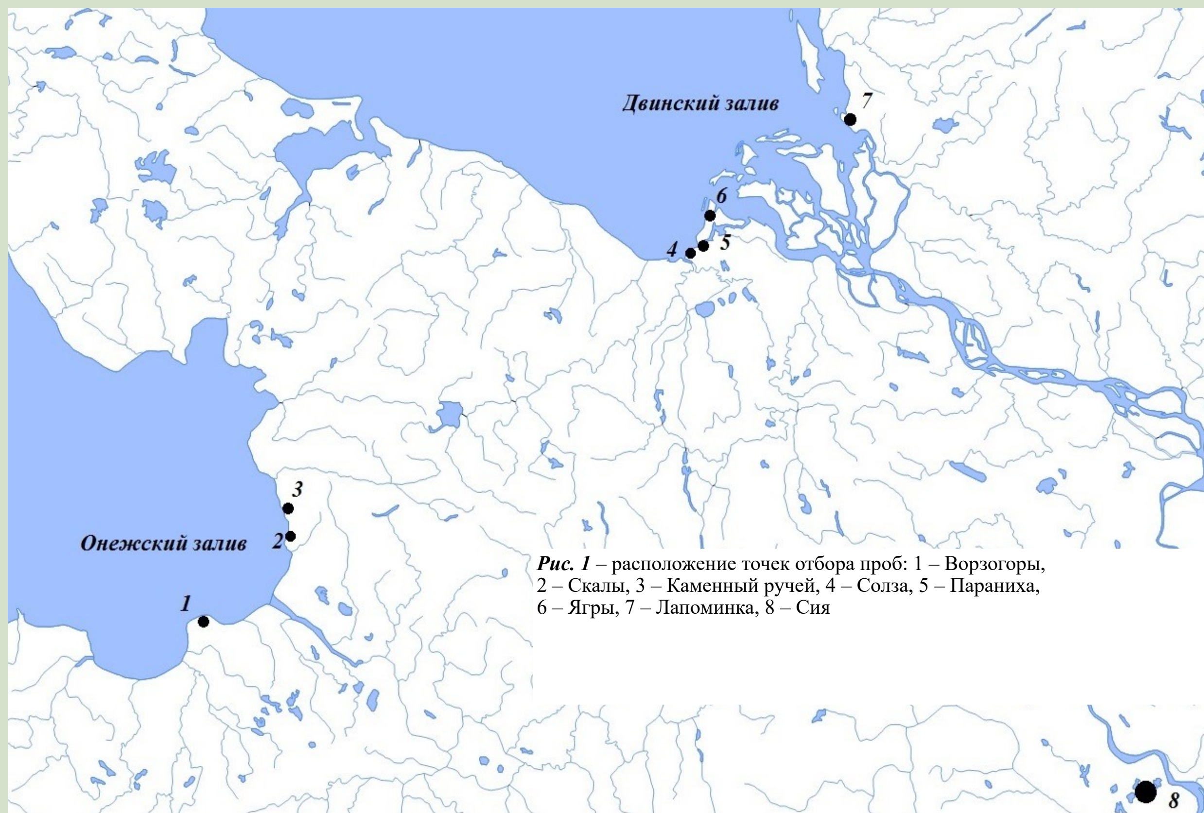
Рис. 1 – расположение точек отбора проб: 1 – Ворзогоры, 2 – Скалы, 3 – Каменный ручей, 4 – Солза, 5 – Параниха, 6 – Ягры, 7 – Лапоминка, 8 – Сия

Неретический бореальный вид Rhizosolenia setigera преобладает в большинстве районов исследования.